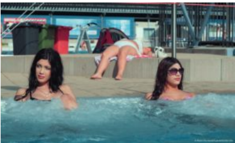
Filmstill aus „Zuhurs Töchter“